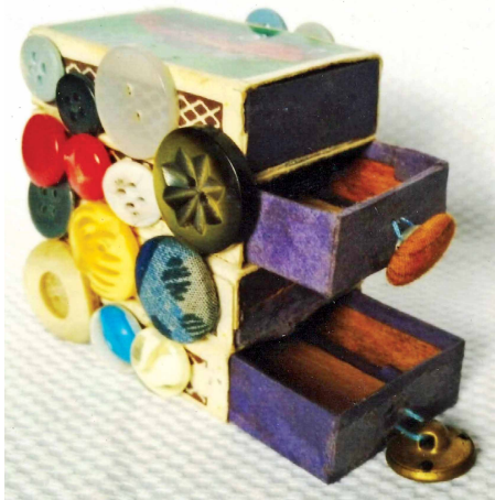
खाली माचिस से अलमारी