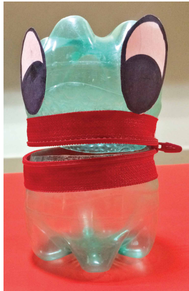
खाली बोटल से पेंसिल बॉक्स