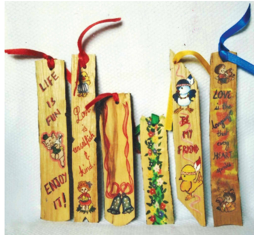
लकड़ी की पट्टी से बुक मार्क