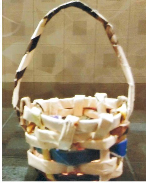
समाचार पत्र से बास्केट